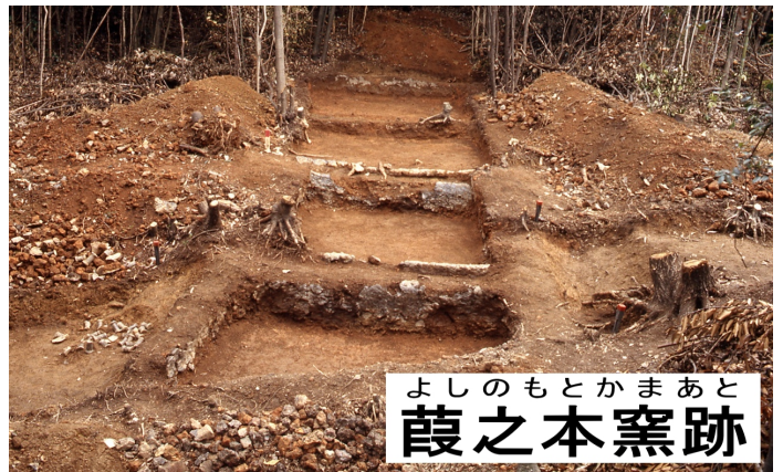
よしのもとかまあと 葎之本窯跡