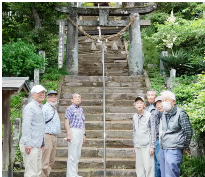
奥に見えるのは大木神社の肥前鳥居

次回は60番札所から巡りますが、今後も新たな発見を楽しみにしながら巡りたいと思います。