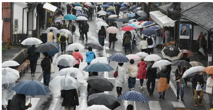
あいにくの雨に見舞われた 4月29日

4月以降はコロナも小康状態、コロナ禍前の盛り上がりになることが期待出来そうです。