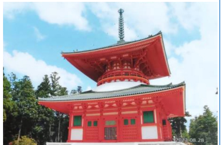
高野山金剛峯寺根本中堂