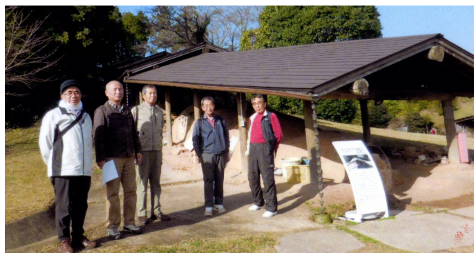
国史跡の畑ノ原窯跡にて