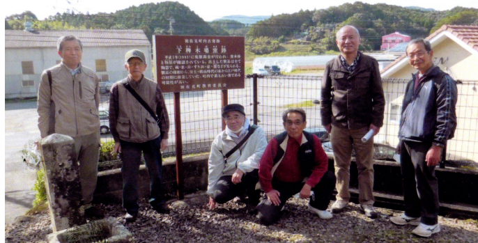
下稗木場窯跡にて