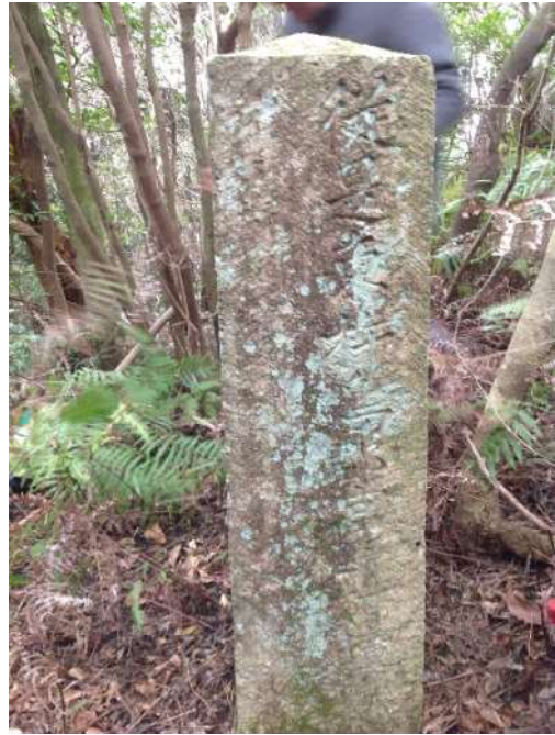
「従是東杵島郡宮野村境」