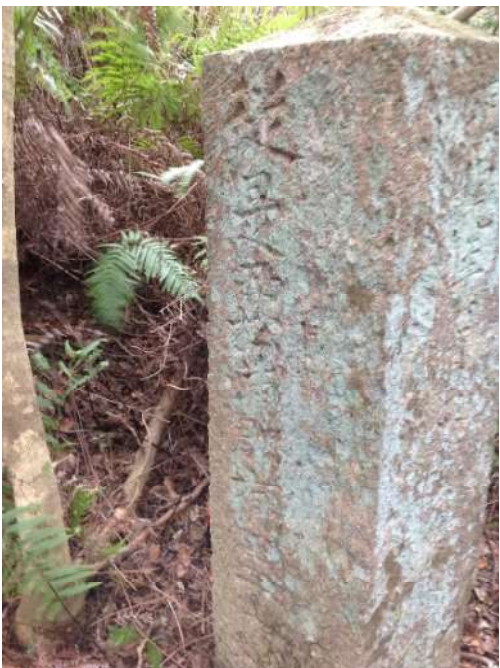
「従是西松浦郡有田皿山境」