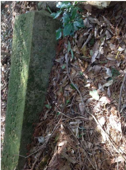
「・・・土石不可堀・・・」土中で判読不可