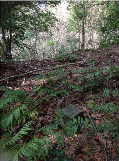
木々の向に近くの切羽面が見える