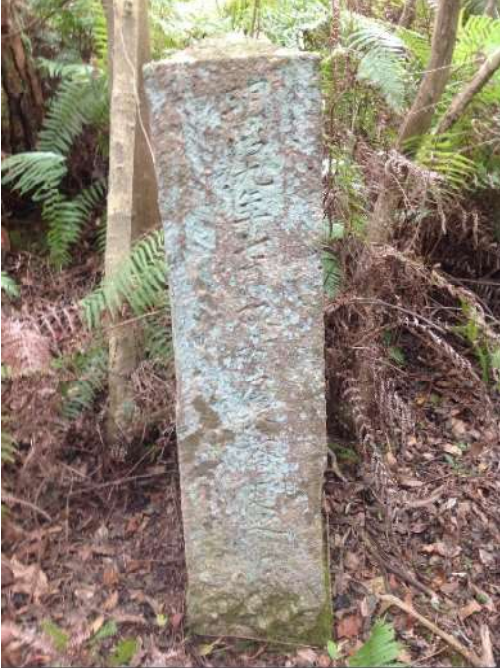
「明治九年七月双方戸長立會建之」