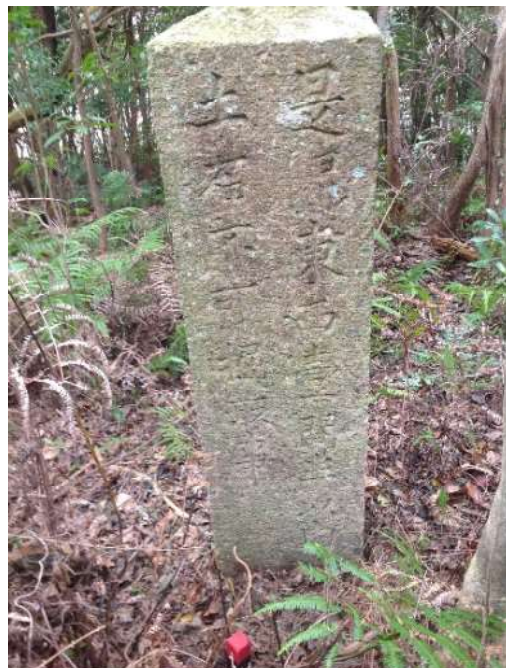
「是邊東西一間半以内土石不可掘取事」