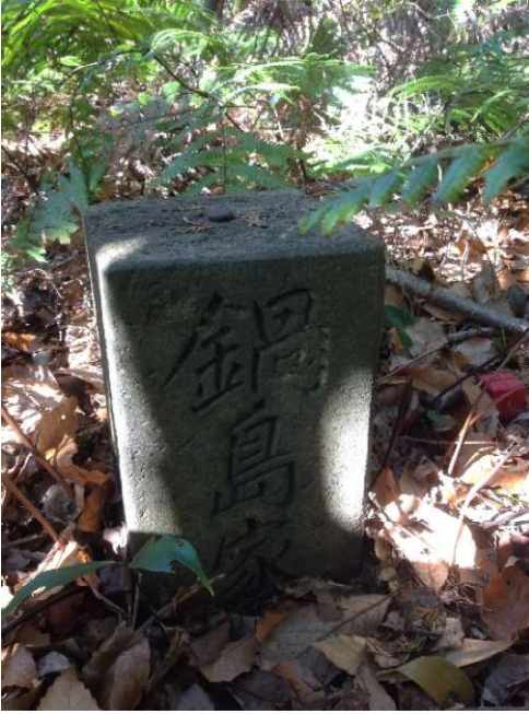
「鍋島家」頂部に鉄鋌有り