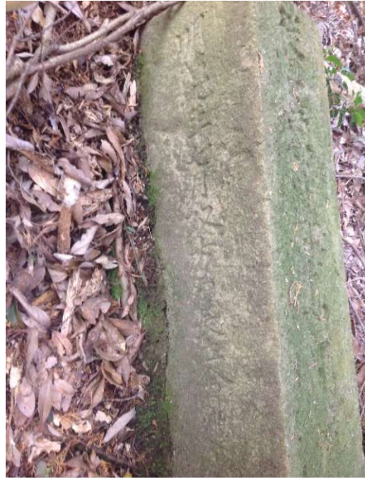
「明治九年七月双方戸長立會建之」