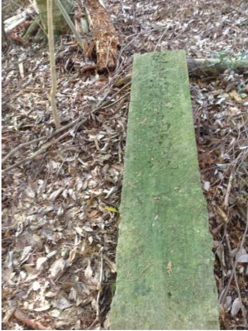
「従是西松浦郡有田皿山境」